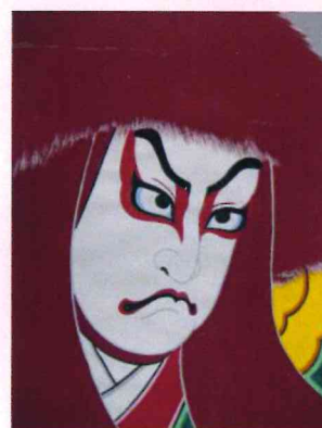
子ども大風合戦大会 茨曾根小 連獅子